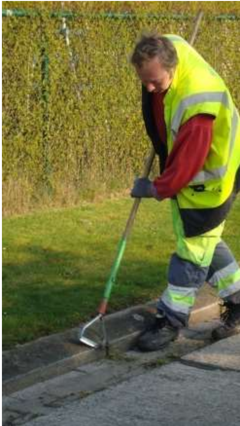
1. Manuele voorbereiding