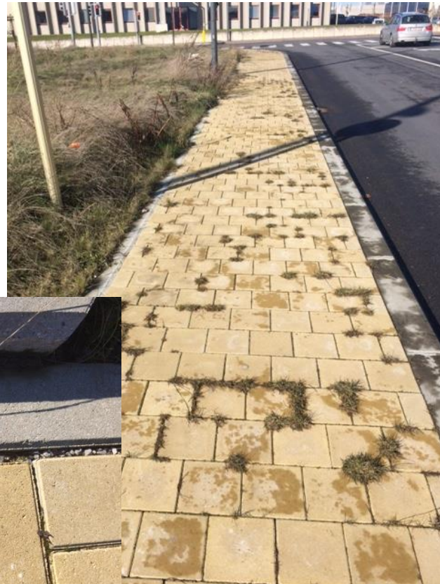
Ch. d'Haecht – 1an après les travaux