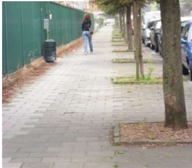
2011 : Copeaux