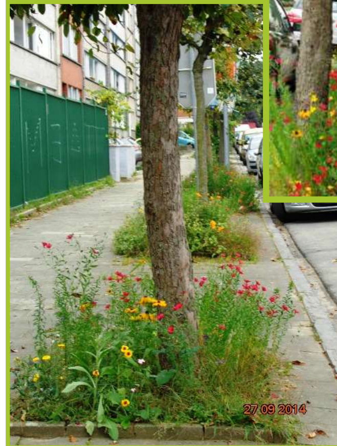
2014 : semis de fleurs